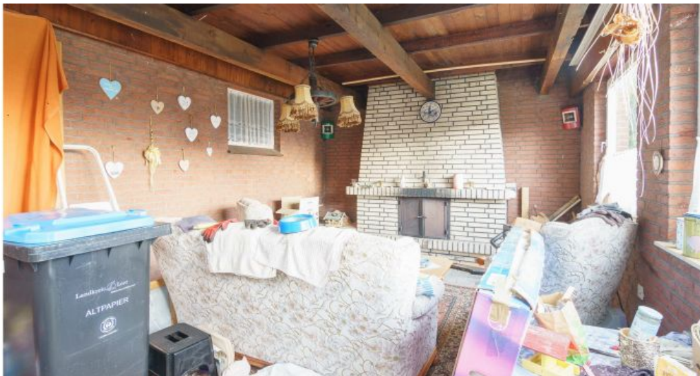
Kaminzimmer an Terrasse