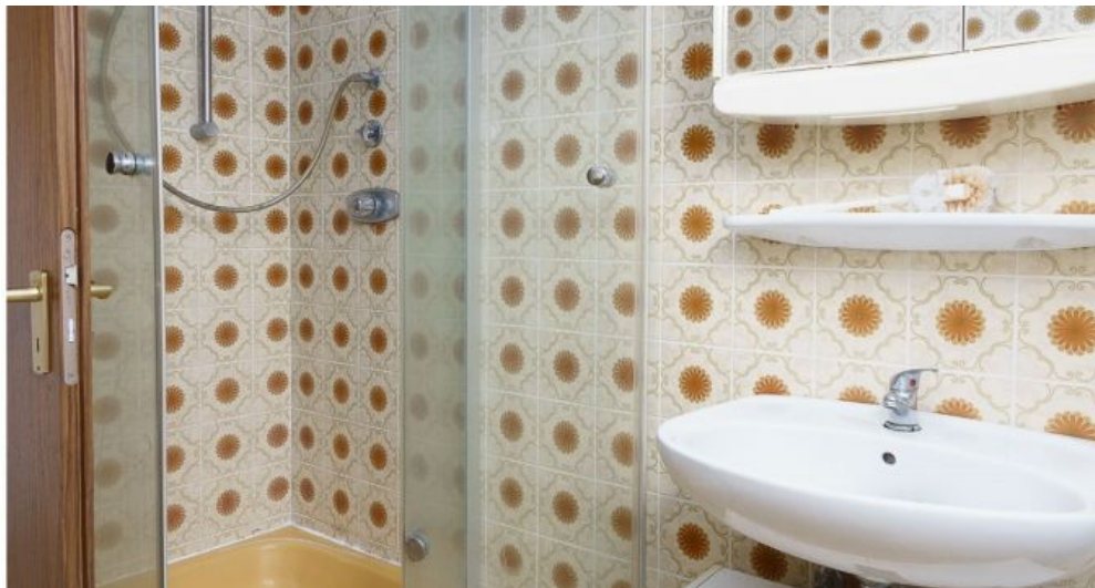
Badezimmer Dusche OG