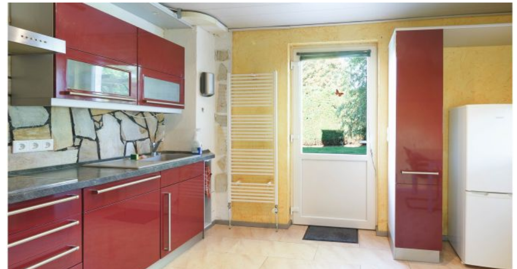
Küche im Anbau