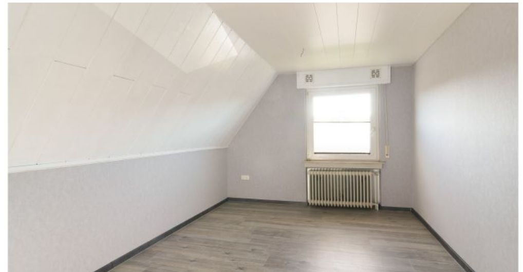
Schlafzimmer 2 OG