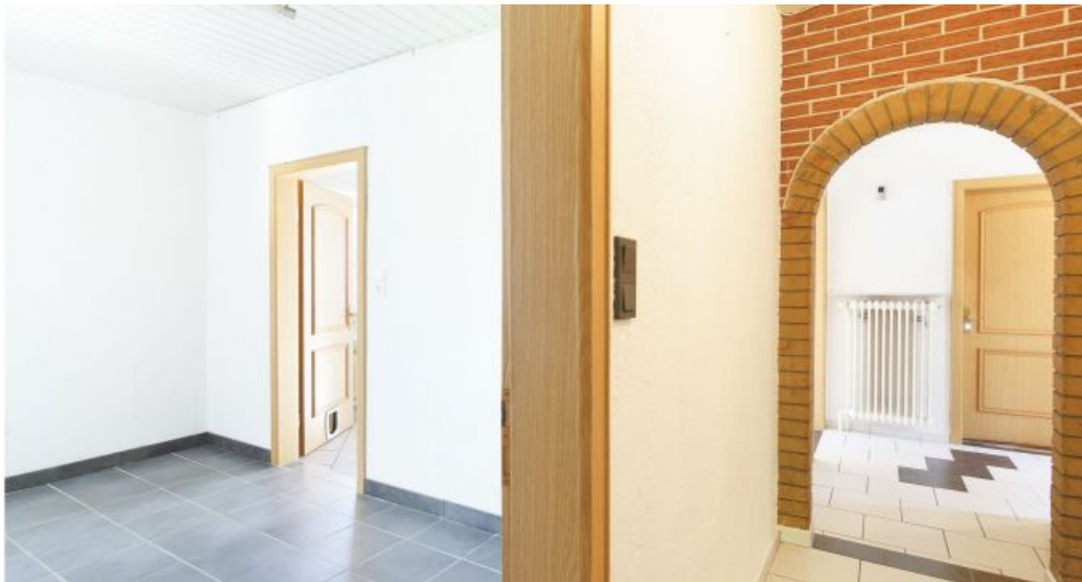
Küche / Flur