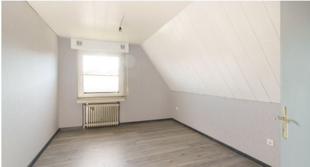
Schlafzimmer 1 OG