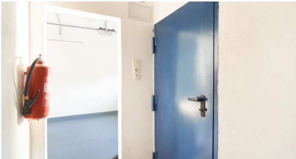
Garage / Heizungsraum