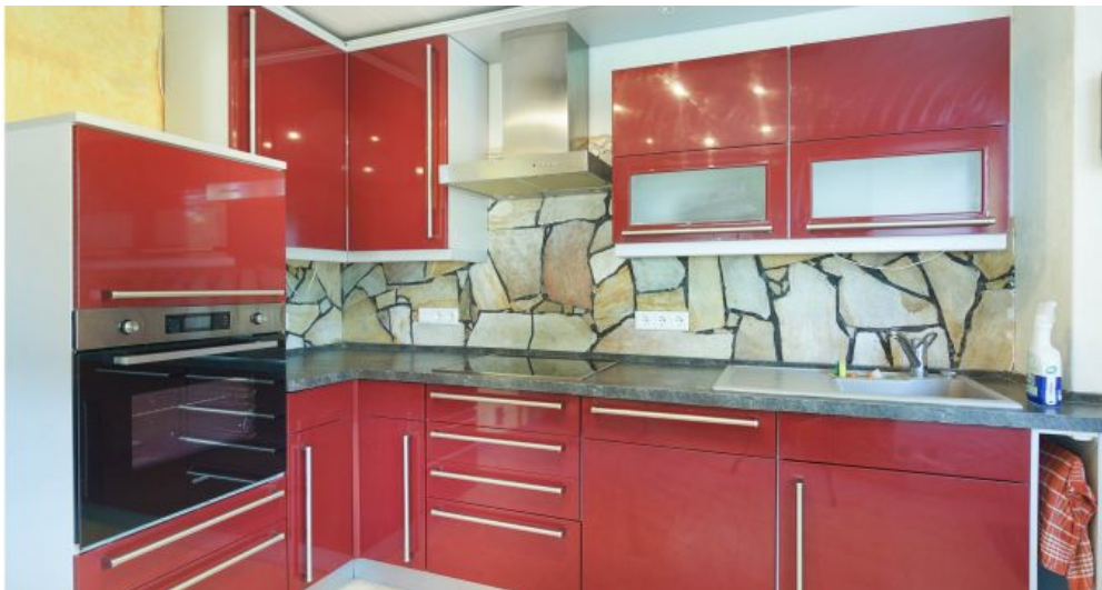
Küche im Anbau