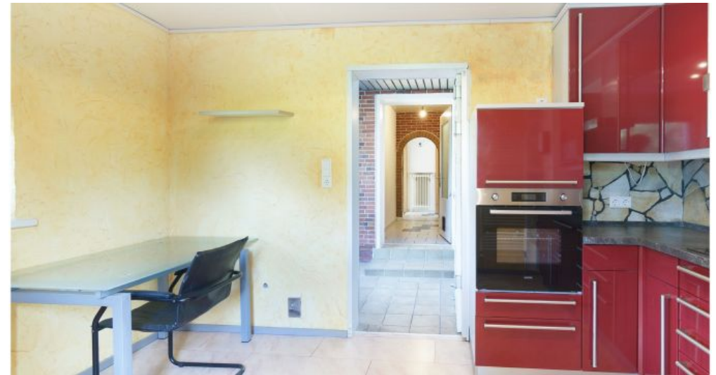
Küche im Anbau