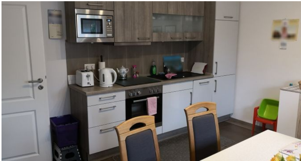
Küche Wohnung C