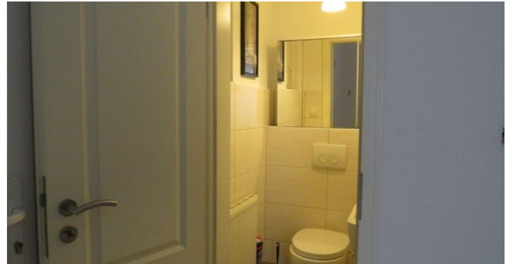
WC Wohnung B