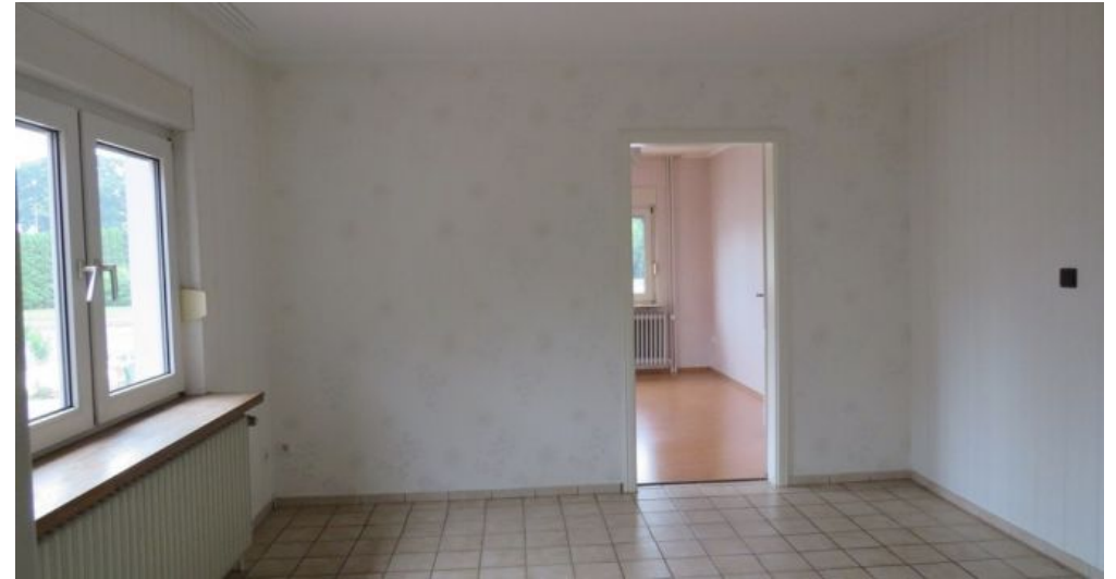
Wohn/Essbereich Wohnung B