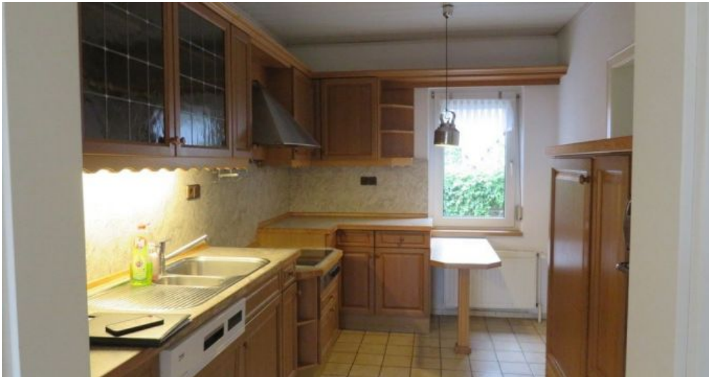
Küche Wohnung B