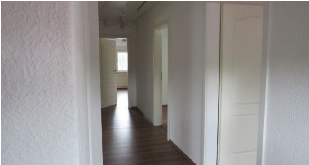
Flur Wohnung B