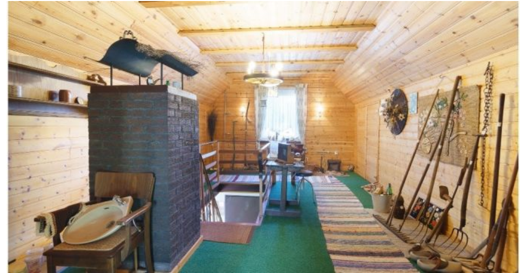
Raum über Garage