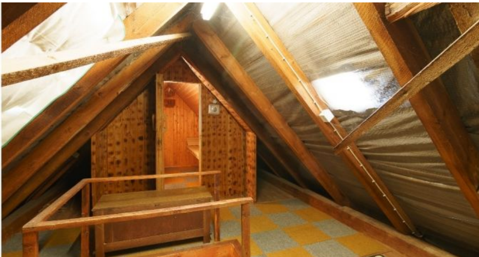
Dachboden mit Sauna