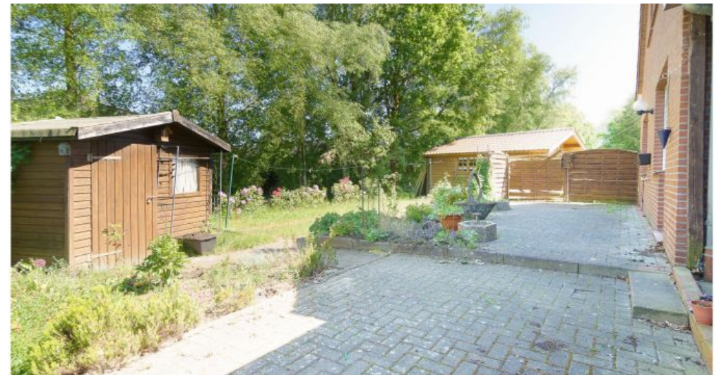
Garten (Terrassen wurden angelegten, keine Stufe mehr)