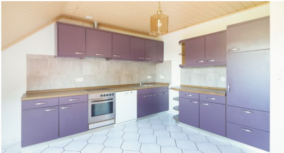
Küche / Esszimmer