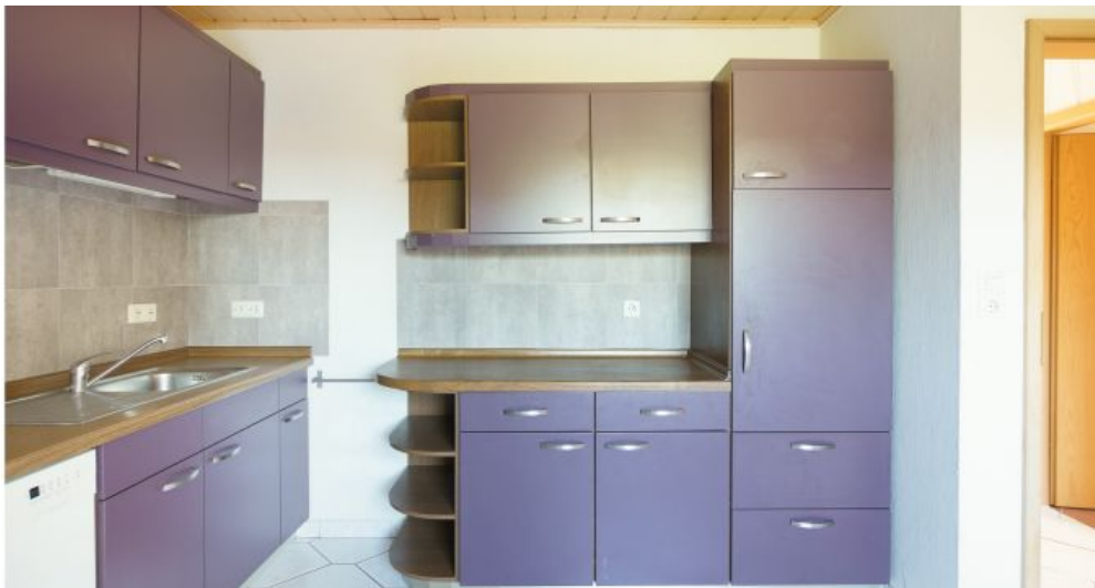
Küche / Esszimmer