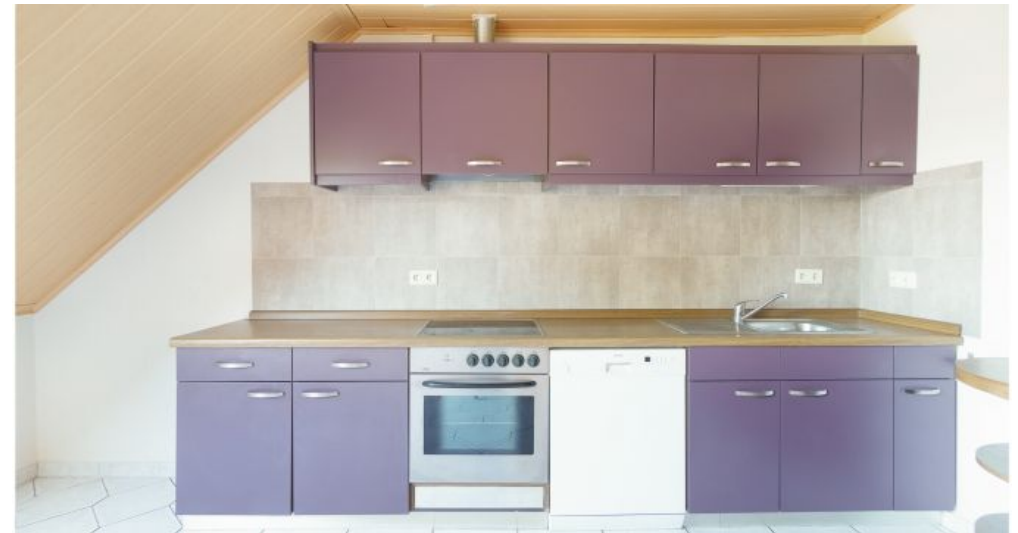
Küche / Esszimmer