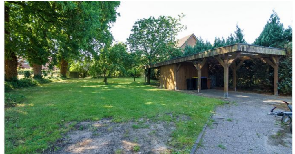
Carport / Garten