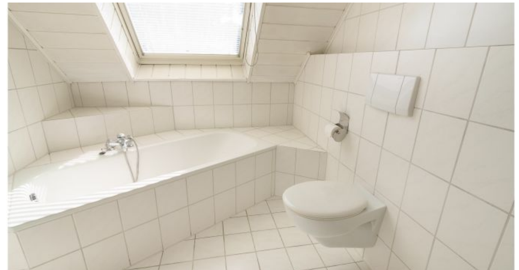
Badewanne / WC