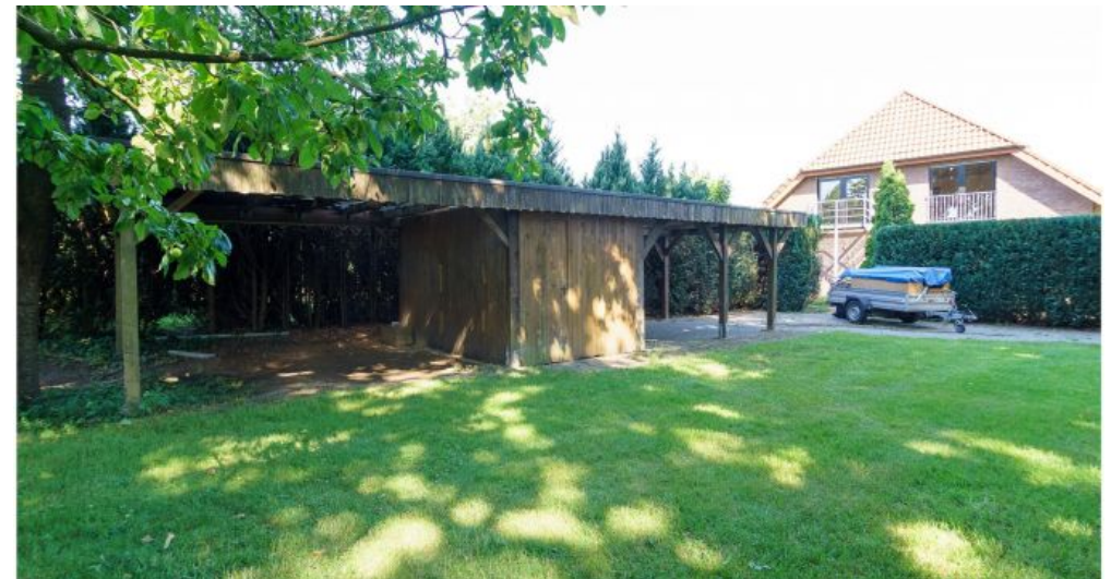
Grillunterstand / Carport / Garten