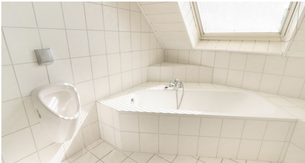
Urinal / Badewanne