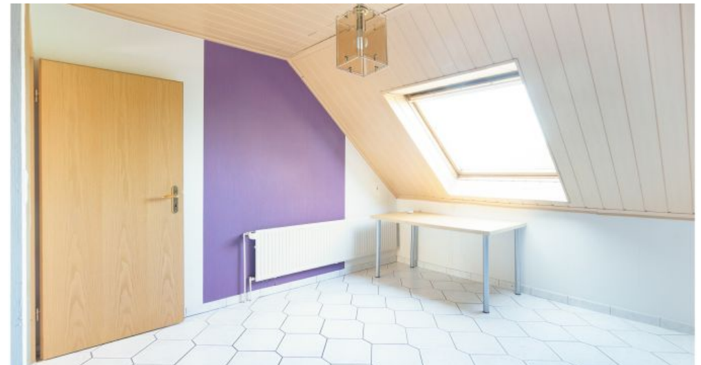
Küche / Esszimmer