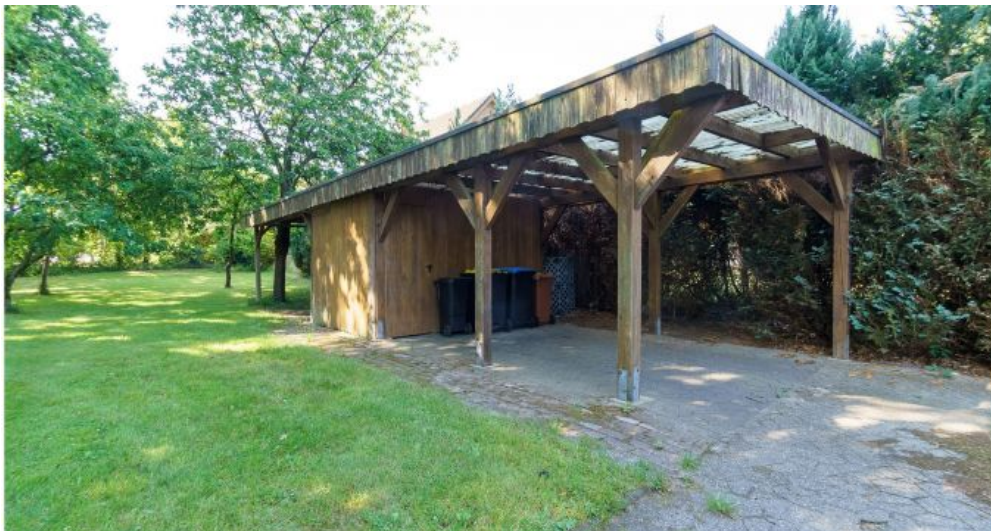
Carport / Garten